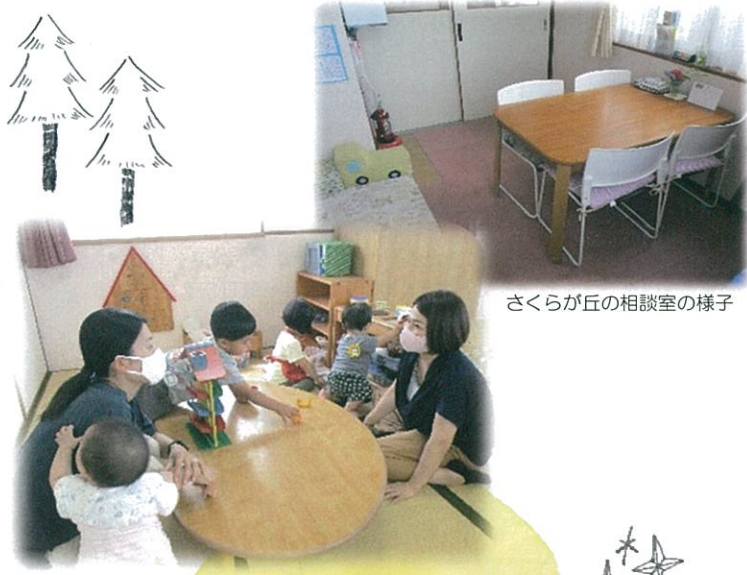
さくらが丘の相談室の様子