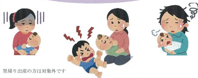
里帰り出産の方は対象外です